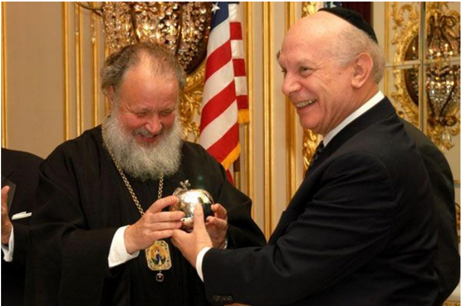
Patriarhul Kiril primind în dar „Mărul lui Adam” de la iudeii din SUA