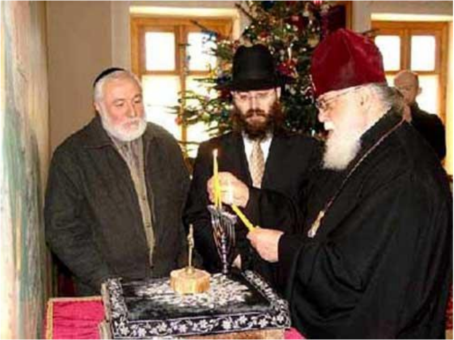
Patriarhul Georgiei Ilia al II-lea aprinzând menora iudaică