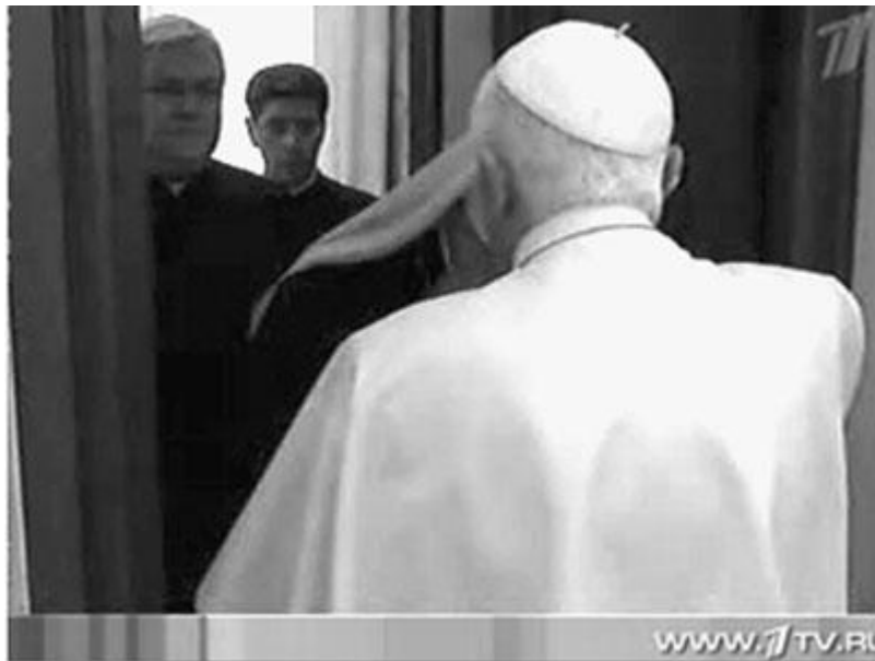
Mitr. Kiril (Gundeaev) închinându-se în fața papei