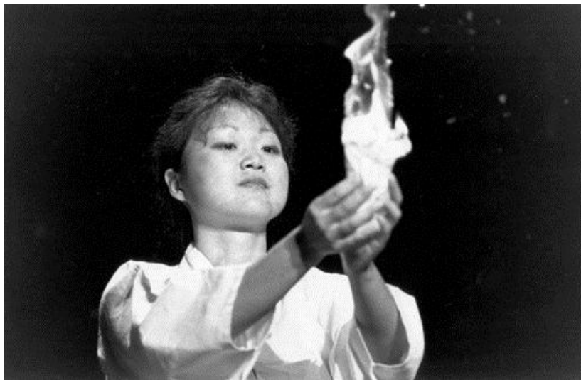
Ritual păgănesc la Adunarea Generală a CMB din Canberra, 1991