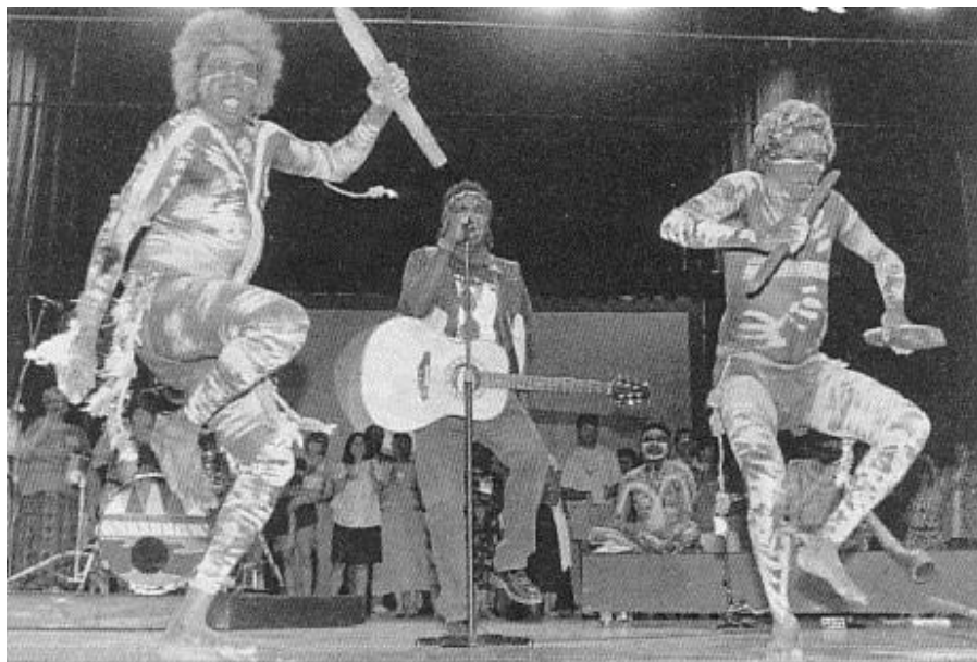
Dănțuiri păgânești la Canberra, 1991