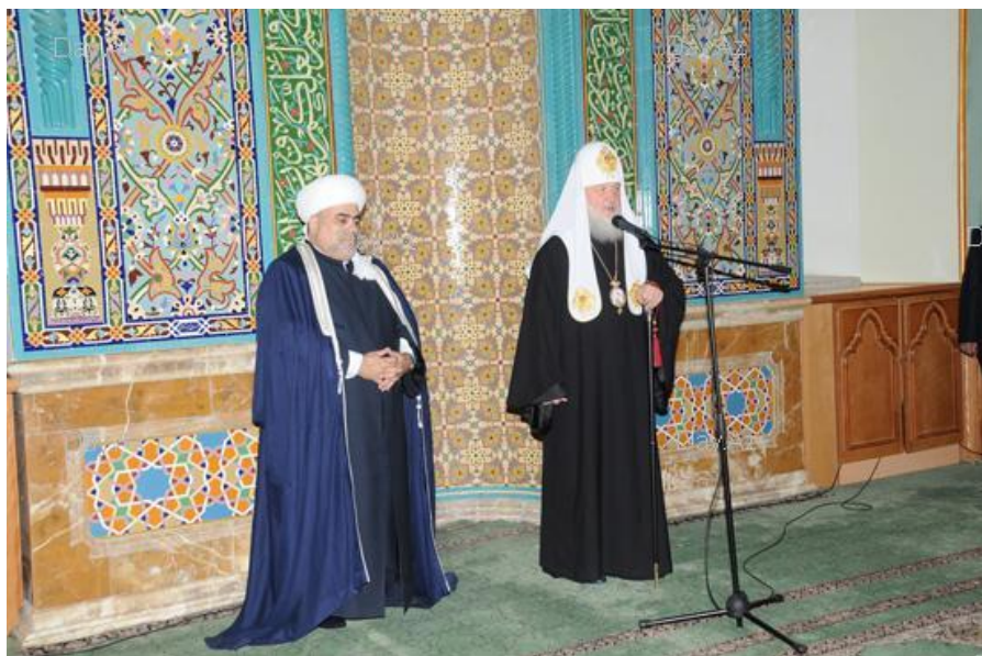
Patriarhul Kiril cuvântând într-o moschee din Baku, Azerbaijan