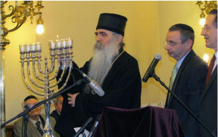
Patriarhul Serbiei Irineu aprinzând menora iudaică