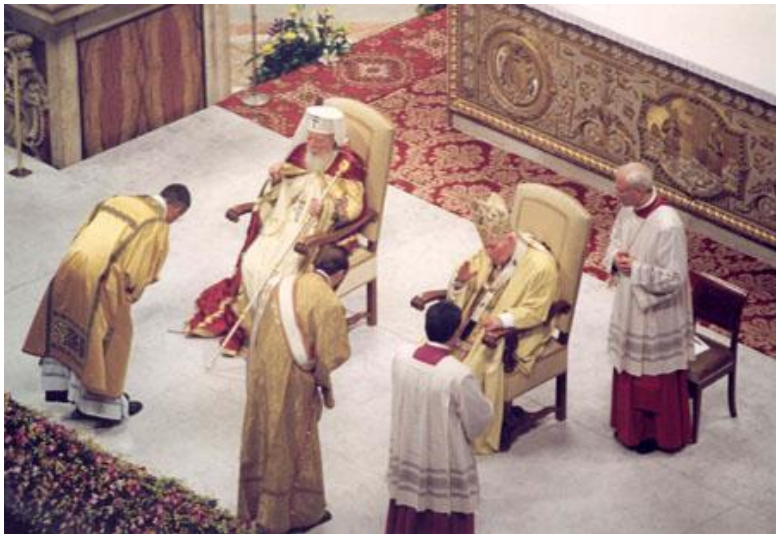
Patriarhul României Teoctist alături de papa Ioan Paul II, binecuvântând diaconii