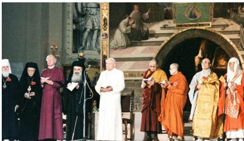
Episcopi ortodocși participând la rugăciunea de la Assisi, 1986