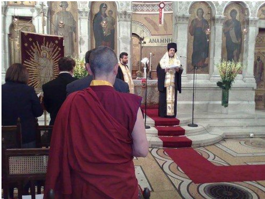
O rugăciune ecumenistă „Charta Oecumenica”, 2008