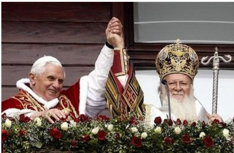
Papa Benedict XVI și Patriarhul Bartolomeu salutând mulțimea