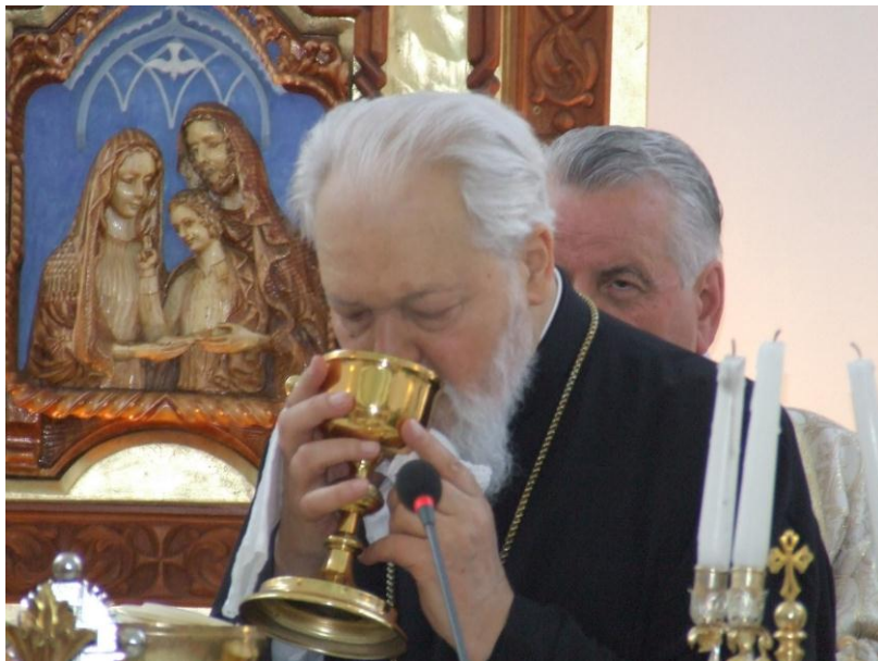
Mitr. Banatului Nicolae (Corneanu) împărtășindu-se la greco-catolici